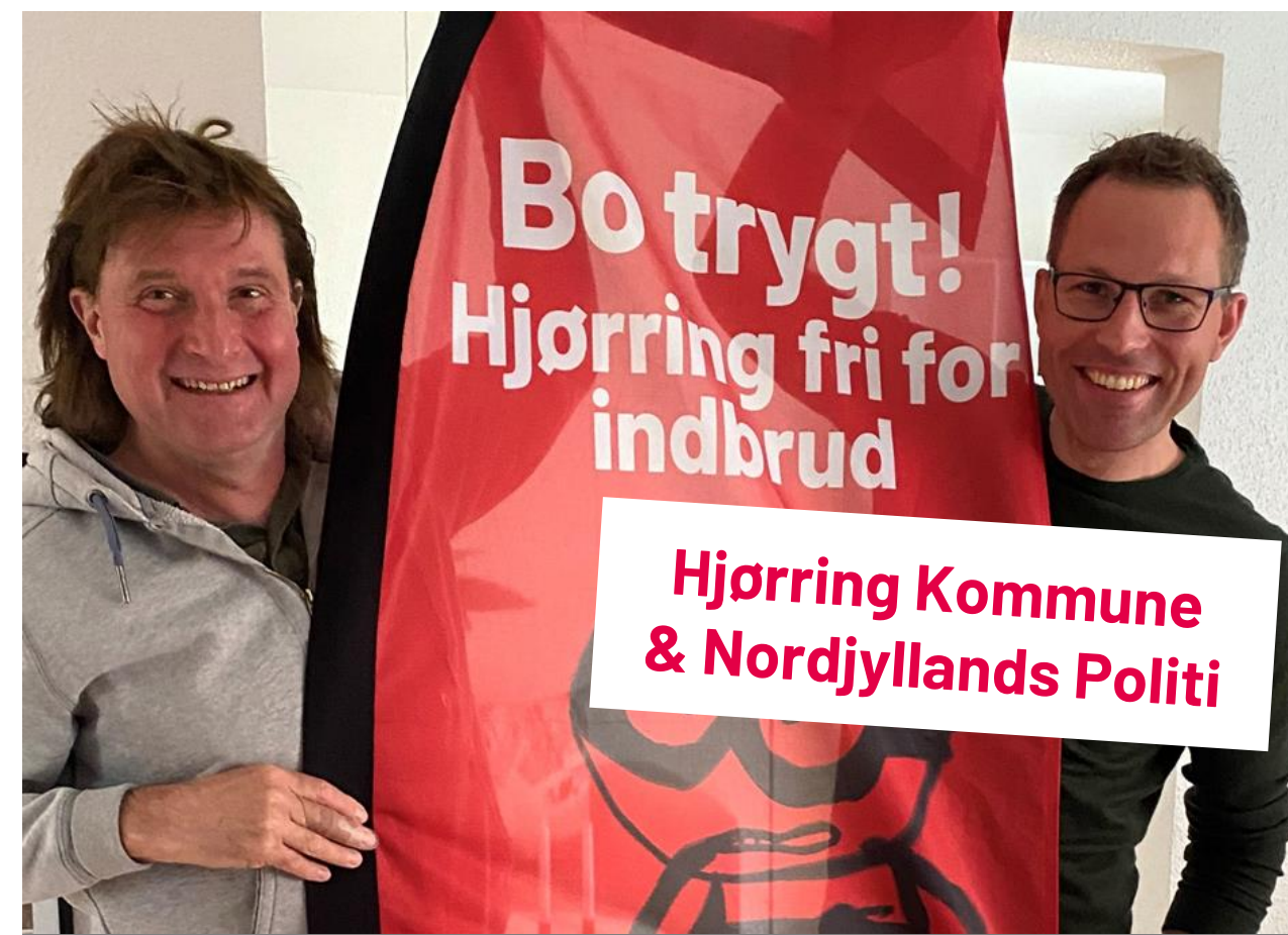
Hjørring Kommune & Nordjyllands Politi