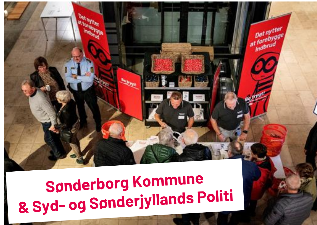
Sønderborg Kommune & Syd- og Sønderjyllands Politi