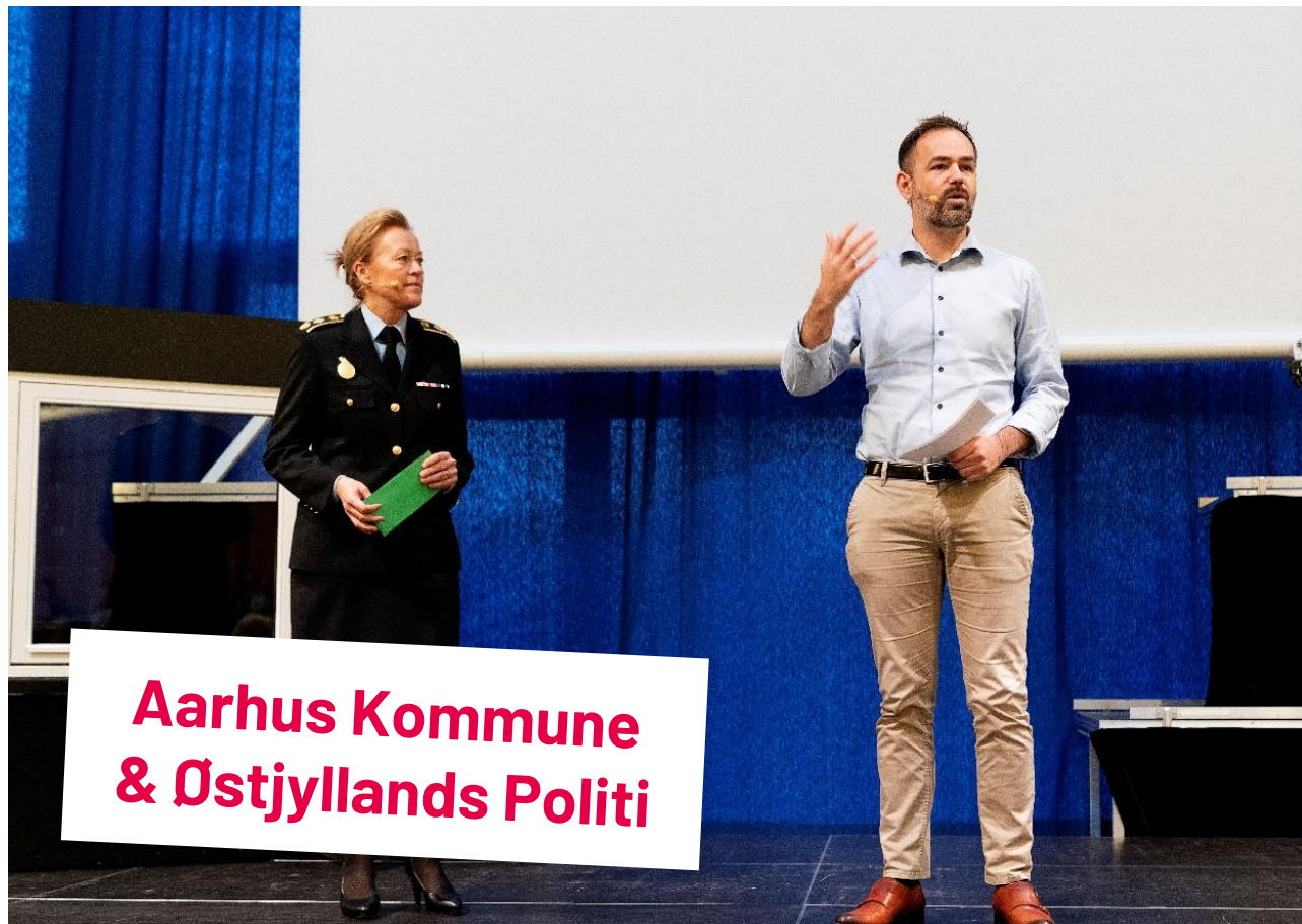
Aarhus Kommune & Østjyllands Politi