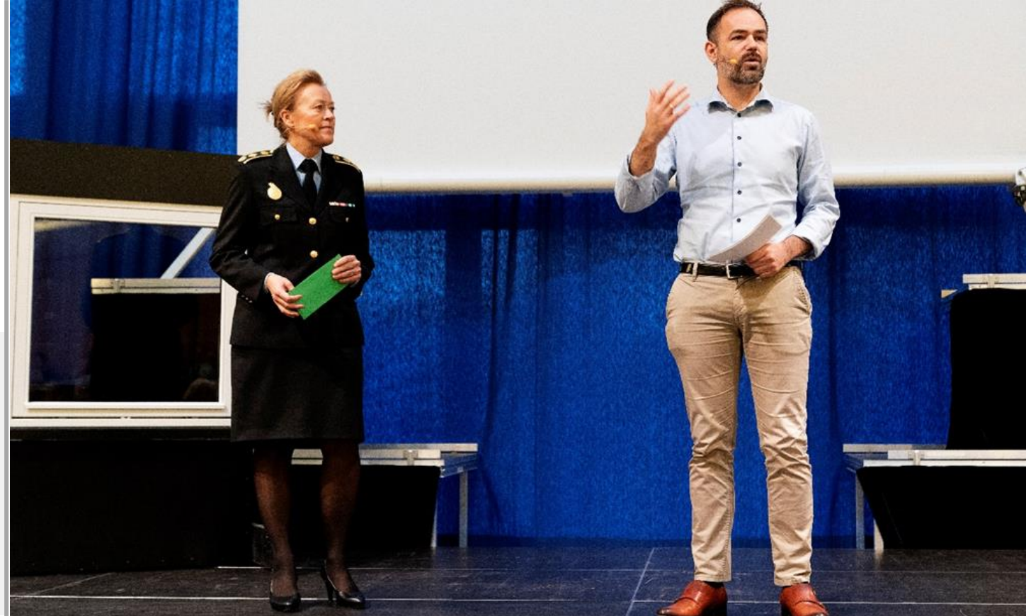
Foto: Østjyllands politi og Aarhus Kommune samarbejder om Bo trygt

Derfor stræber vi efter at skabe en bevægelse i Danmark, hvor kommuner og de tilhørende politikredse etablerer forpligtende samarbejder om at forebygge indbrud.