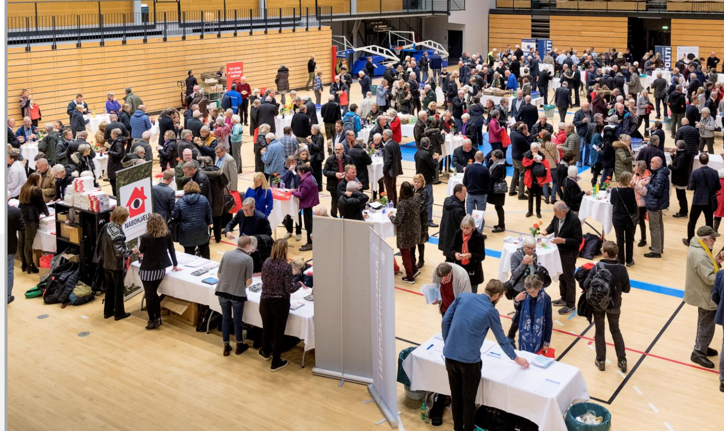
Foto: Borgermøde i samarbejde mellem Furesø Kommune, Nordsjællands Politi og Bo trygt

Derfor arbejder vi i kommune og politi for at gøre borgerne mere bevidste om, hvad de kan gøre for at forebygge indbrud – inden uheldet er ude.