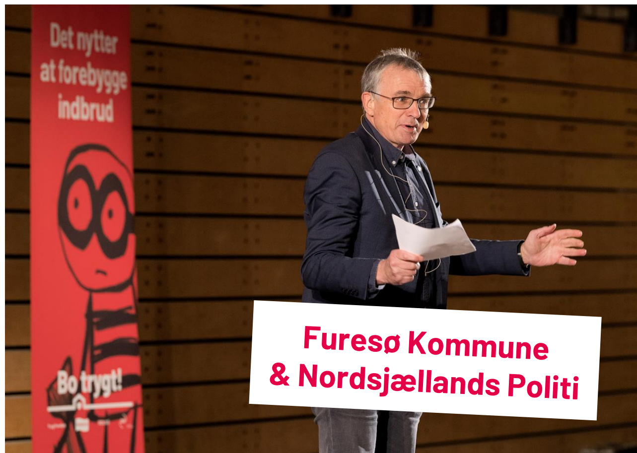
Furesø Kommune & Nordsjællands Politi