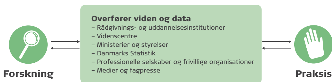
FIGUR 2: ORGANISATIONER, DER KAN FORBINDE FORSKNING OG PRAKSIS

Hvis TrygFondens midler skal gøre størst mulig gavn, så må TrygFonden også arbejde med at udvikle, afprøve og forankre metoder, der kan sikre en bedre vidensoverførsel mellem forskning og praksis. Metoder der kan nyttiggøres inden for mange fokusområder.