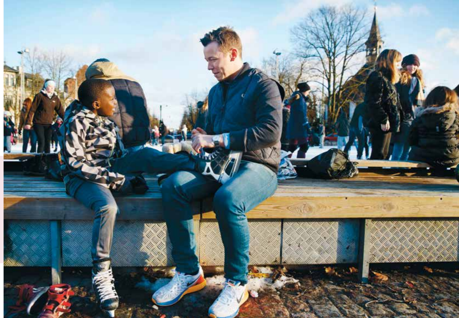
Herover: Børns Voksenvenner giver udsatte børn en vigtig voksenkontakt, der kan gøre en livsvarig positiv forskel for barnet. Til venstre: Kørestolsbasket giver fysisk handicappede mulighed for at blive en del af et vigtigt fællesskab på og uden for banen.

TrygFonden arbejder med områder, der er centrale for danskernes trivsel: Hvordan vi ruster vores børn til et godt liv, og hvordan vi tager ansvar for andre menneskers trivsel.