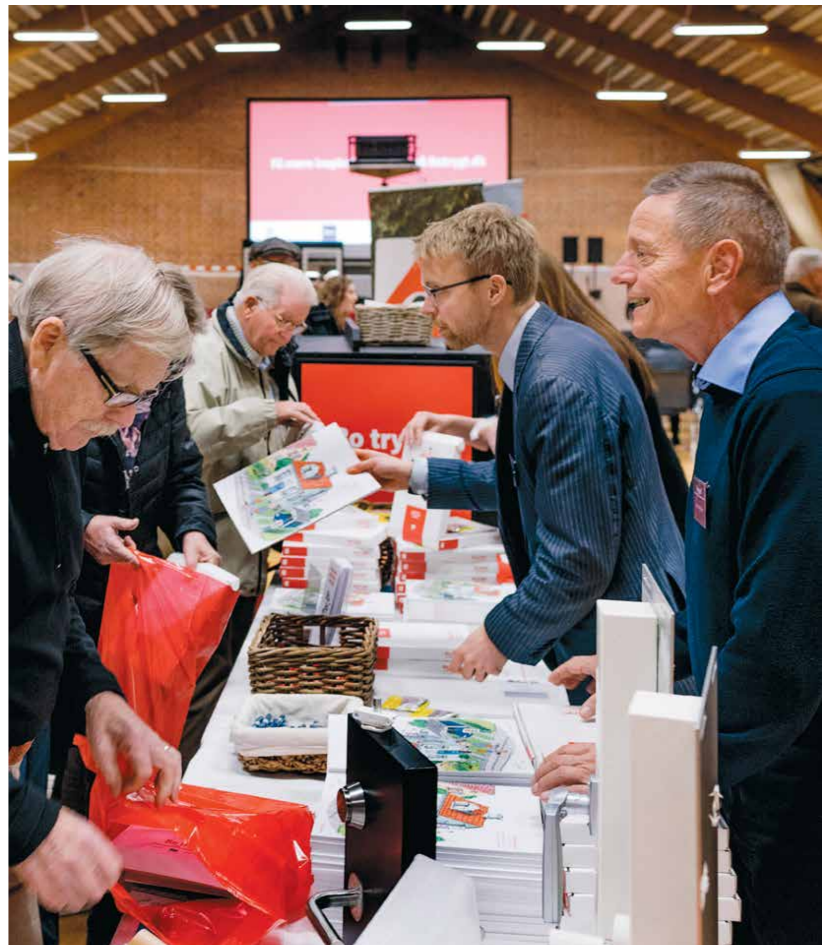
TrygFonden afholder hvert år en lang række borgermøder, konferencer og udadvendte aktiviteter, hvor vi møder danskerne og deler den nyeste viden inden for sikkerhed, sundhed og trivsel.