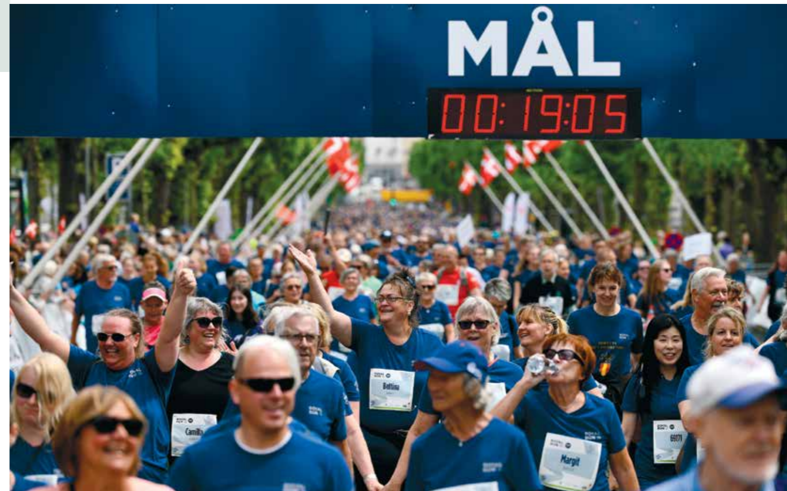
Godt 70.000 danskere fejrede 21. maj 2018 Kronprins Frederiks 50-års fødselsdag ved at løbe Royal Run. TrygFonden samarbejder med DGI, DIF og Nordea-fonden om visionen Bevæg dig for livet. Ambitionen er, at 600.000 flere danskere dyrker idræt i 2025.

Alle skal have et trygt møde med sundhedsvæsenet. Patienten skal mødes som menneske, ikke som en sygdom, og ikke alle kommer med de samme forudsætninger. TrygFonden vil arbejde for, at samarbejdet mellem personale og patient optimeres, så patienter og deres pårørende i højere grad høres og inddrages.