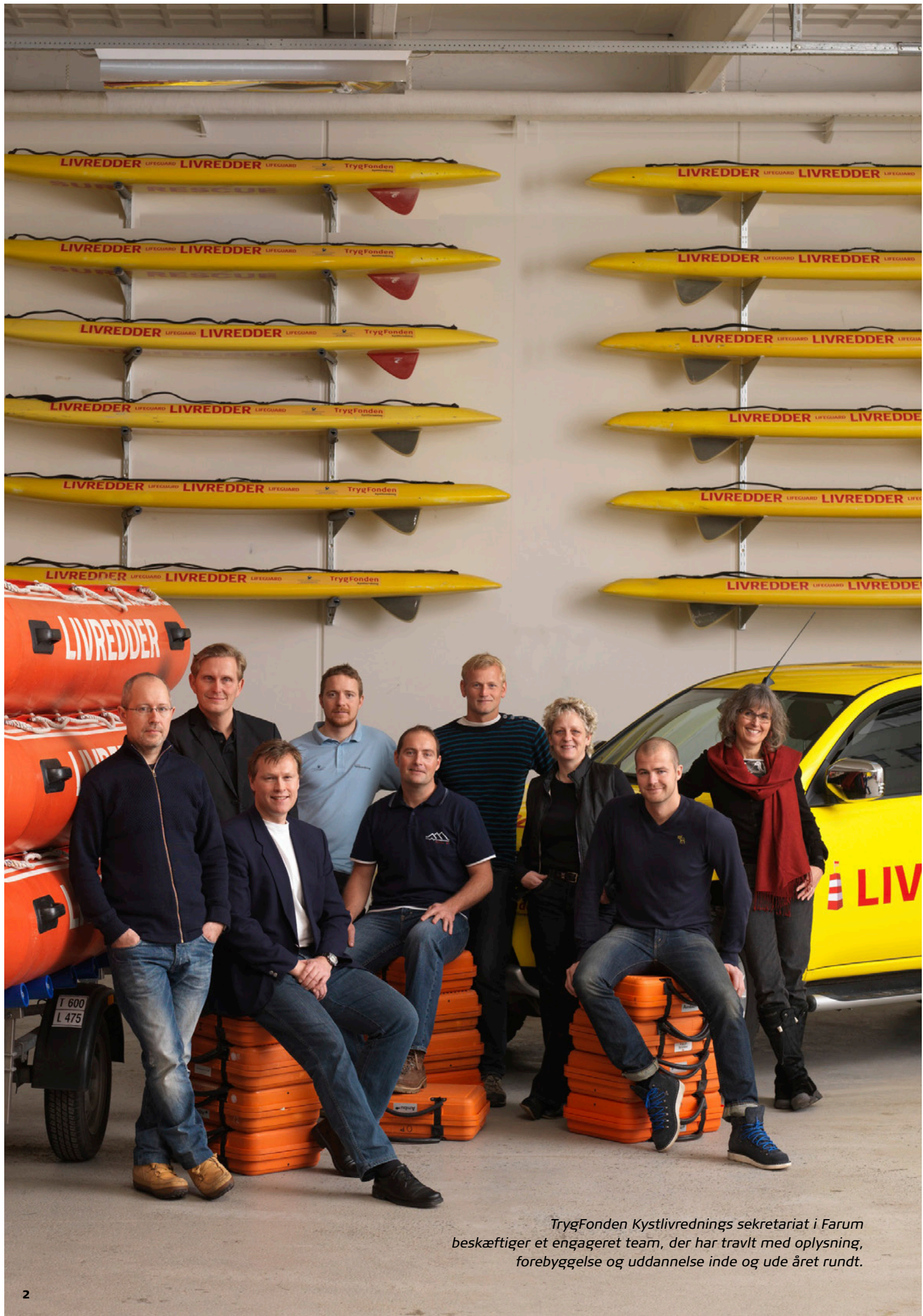
TrygFonden Kystlivreddnings sekretariat i Farum beskæftiger et engageret team, der har travlt med oplysning, forebyggelse og uddannelse inde og ude året rundt.